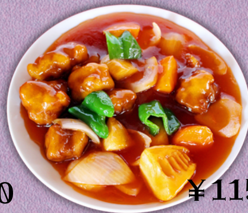
¥1150 揚げ白身魚の甘酢かけ