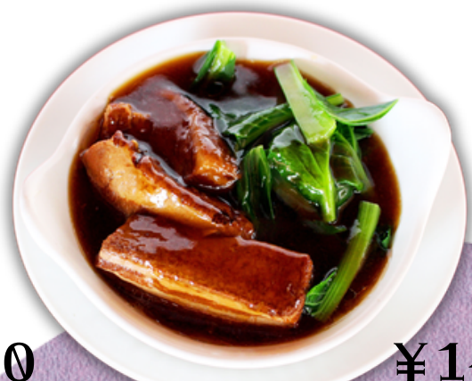
¥1400 豚肉の柔らか煮込み