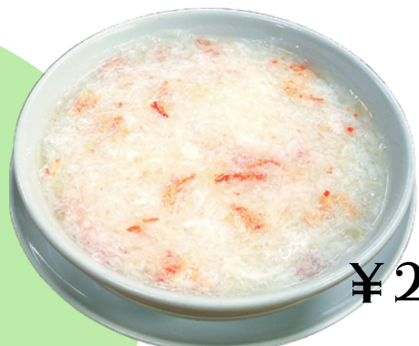
¥2200 カニ肉入りフカヒレスープ