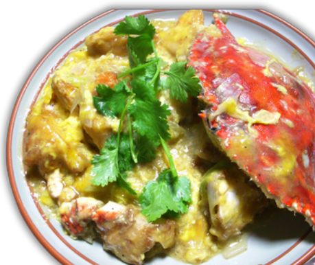
¥2000 わたり蟹の玉子煮込み