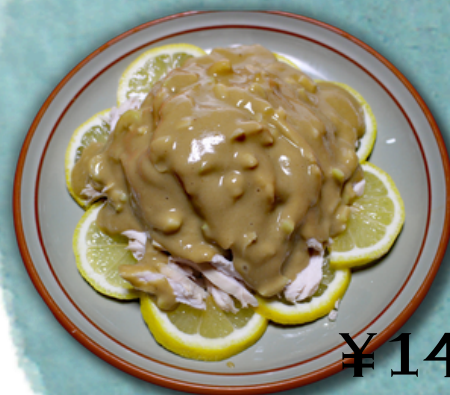
¥1400 蒸し鶏の冷菜ゴマソースかけ