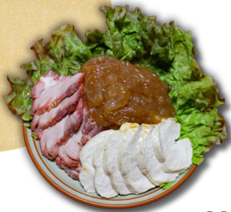
¥3000 三種冷菜盛り合わせ