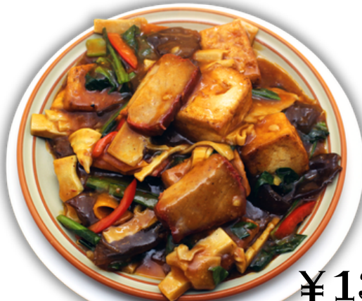
¥1300 チャーシューと揚げ豆腐のうま煮