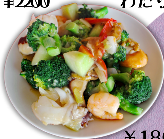
¥1800 海鮮と季節野菜の炒め