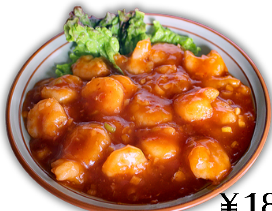
¥1800 エビのチリソース炒め