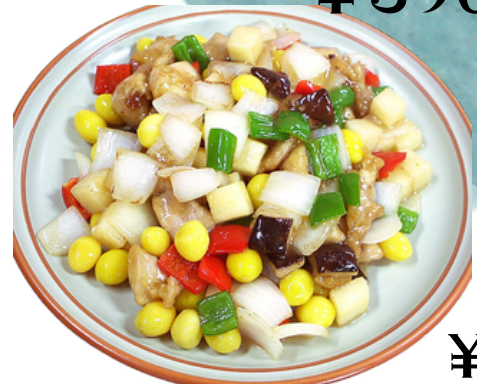
¥1300 鶏肉とギンナの炒め