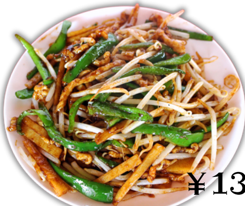
¥1300 チンジャオロースー