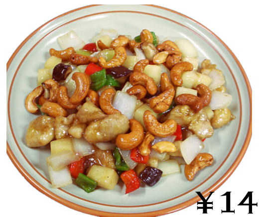
¥1400 鶏肉とカシューナッツの炒め