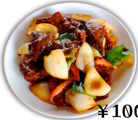
¥1000 豚レバーの辛子炒め