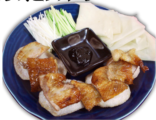
北京ダック (半羽) ¥2200