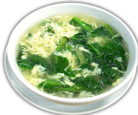
野菜入り玉子スープ ¥600