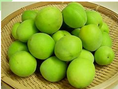
自家製梅ジュース